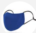
0022 Disponible S L