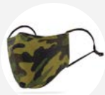
0056 Disponible L