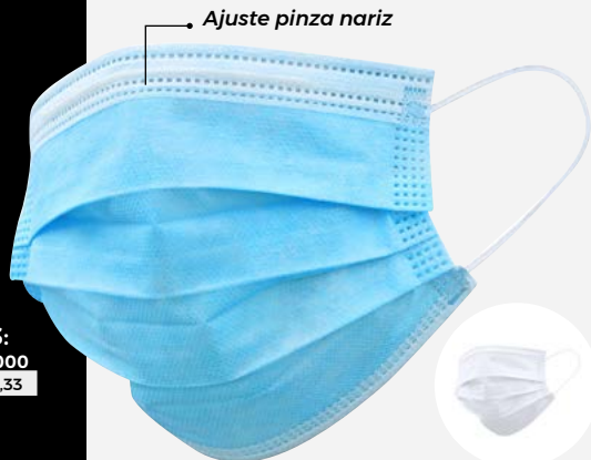
0004 Disponible S L