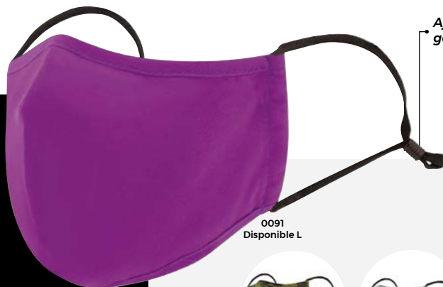
0091 Disponible L