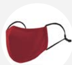
0003 Disponible S L