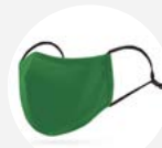
0006 Disponible S L