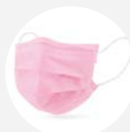
0003 Disponible S