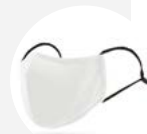
0001 Disponible S L