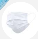
0001 Disponible L