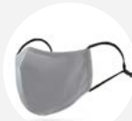
0008 Disponible L