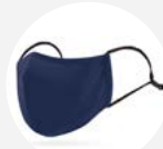
0015 Disponible L