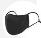
0002 Disponible L