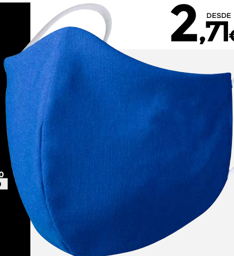
0004 Disponibile S M L